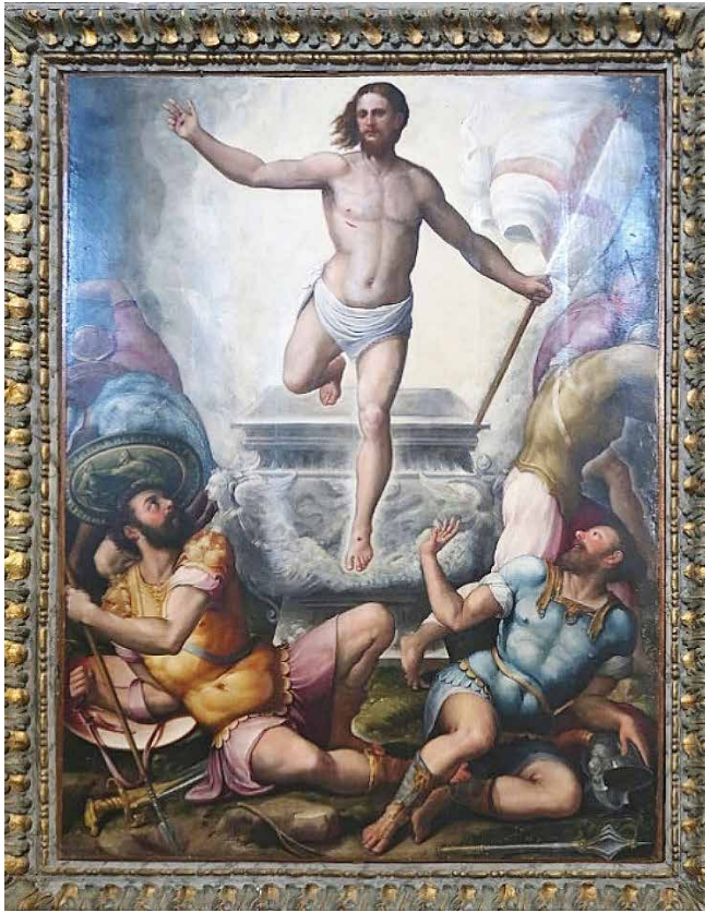
Résurrection du Christ, Orazio Alfani, Huile sur toile, 1553, église San Pietro, Perugia.