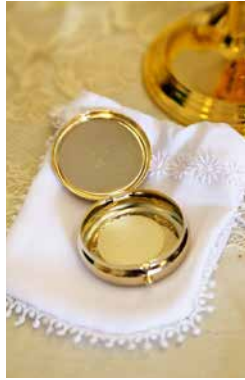
La custode, cette boîte dorée permet d'apporter la communion aux malades.

Comme chaque année, le diocèse organise une journée de formation pour les nouveaux auxiliaires de l'Eucharistie, ce sont les personnes qui aident le prêtre à distribuer la communion.