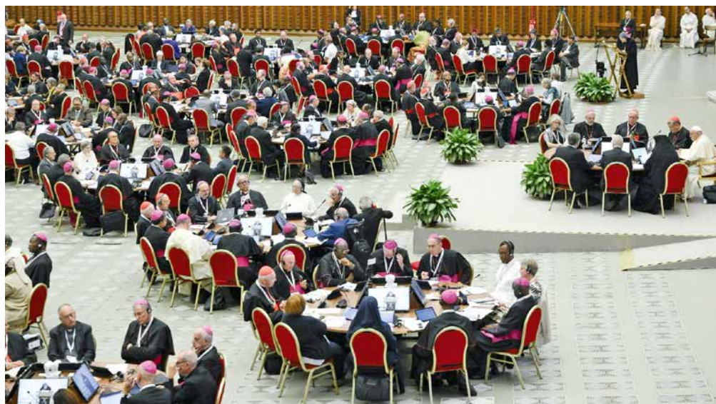
Une nouveauté: les membres du synode assis à des tables rondes.

une deuxième rencontre qui débouchera sur des propositions définitives qui seront faites au Pape. C'est ensuite à lui seul que reviendra le pouvoir de trancher et de présenter les conclusions qu'il retient pour la mise en œuvre de celles-ci.