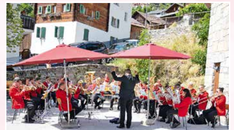
La fanfare a apporté une touche musicale lors de l'apéritif qui a suivi la messe.