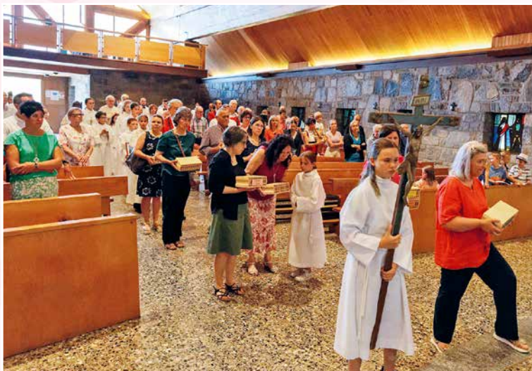
Jeunes et moins jeunes réunis dans la joie pour célébrer.