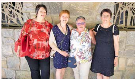
Des membres de la classe 1963 de Vex venues fêter leur église.