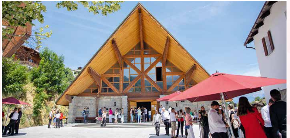
L'église paroissiale de Vex rassemble les paroissiens pour célébrer ses 60 ans.

L'autel, constitué d'une table en marbre blanc, repose sur un socle dont la forme rappelle la lettre grecque oméga. Le grand crucifix du chœur date du XIV e siècle. Les vitraux latéraux, qui constituent les 14 stations du chemin de croix, sont l'œuvre de l'artiste-peintre Albert Chavaz de Savièse. A gauche trône une statue de saint Sylve, le patron de la paroisse.