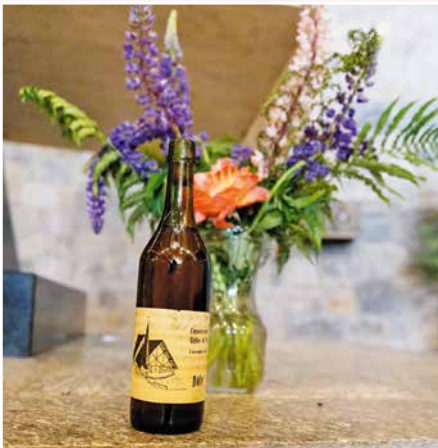
Une bouteille émise lors de l'inauguration de l'église en 1963 a été gardée précieusement par son propriétaire jusqu'à aujourd'hui.