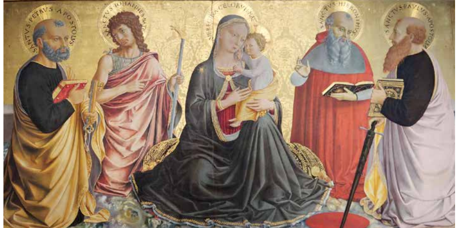
Benozzo Gozzoli, Firenze, 1456, Musée National de l'Ombrie, Perugia.

Le peintre a placé à la droite de Marie Jean-Baptiste qui désigne Jésus comme l'Agneau de Dieu. A gauche du tableau figure Pierre, portant les clés, signes de la mission que Jésus lui a confiée. Tout à droite se trouve Paul , avec un livre et l'épée. Le glaive rappelle que, selon la tradition, Paul est mort décapité. Mais l'épée est surtout le symbole de la Parole de Dieu qui peut pénétrer très profondément dans le cœur de celui qui est touché par son message (cf Eph 6, 17). L'épée nous montre que Paul a été serviteur de Dieu qui nous parle.