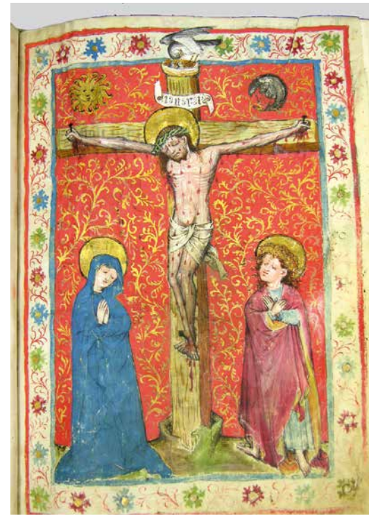
Enluminure tirée du Missale Speciale Sedunense, Ms 19, 1439. Chapitre Cathédral de Sion.

Jn 15, 13 Que cette enluminure, avec la richesse de ses symboles, nous aide durant ce Carême, à méditer sur le mystère du Christ qui donne sa vie par amour.