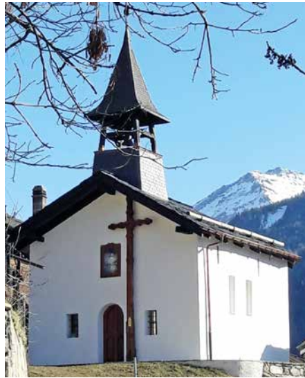
La chapelle et la façade d'entrée.

On peut entre autres y admirer des peintures murales représentant saint Marc et saint