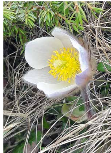
Anémone: après l'hiver, la vie reprend ses droits.

Demandons-nous quels passages nous avons à traverser pour être plus justes dans nos relations, afin d' accueillir le Ressuscité dans nos vies et de faire avancer sa paix et son amour.