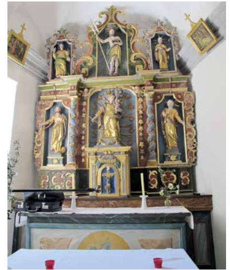
Le maître-autel avec le tabernacle.

La récente restauration a bénéficié d'un large soutien financier de la population et