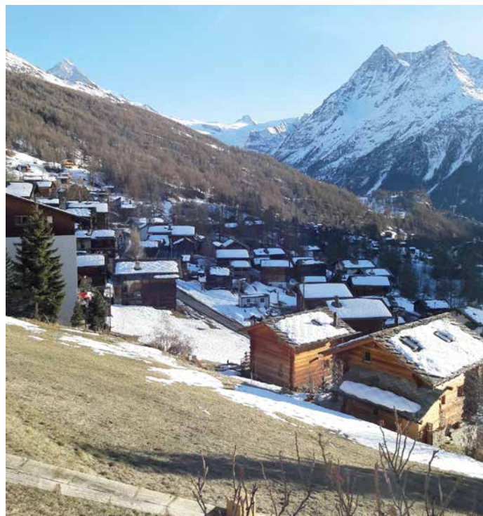
Le village de Villa et les Veisivis.