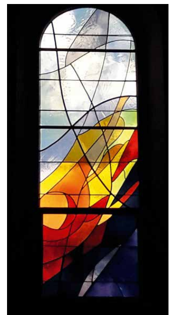
Vitrail du soleil.

ont été accueillis à la salle bourgeoise pour partager ensemble une bonne raclette.