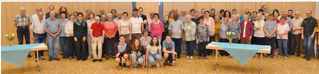
3 juin: souper de remerciement pour les bénévoles de la paroisse d'Hérémece et les classes 5 et 6, organisatrices du 50 e anniversaire de l'église.