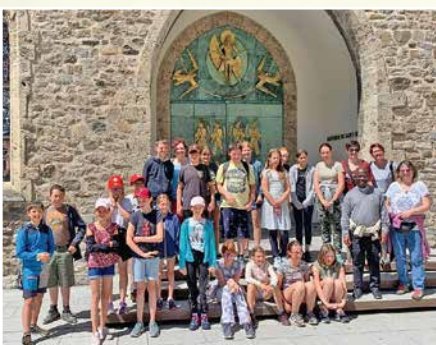
11 juin: sortie des servants de messes d'Evolène, Hérémece et Vex à l'abbaye de Saint-Maurice et au Labyrinthe Aventure.