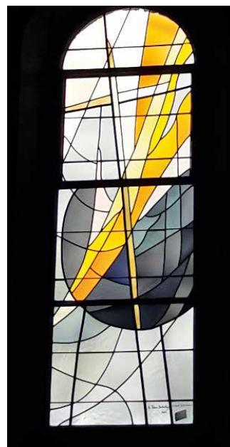
Vitrail de la Résurrection.

Après avoir écouté avec intérêt ces explications éclairantes de l'artiste qui a dessiné les nouveaux vitraux, les prêtres et laïcs du décanat