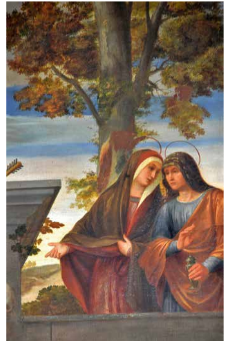
Marthe et Marie, Cathédrale de Sion.

L'ami reçu, c'est Dieu lui-même, qui vient visiter Marthe et Marie, qui vient nous visiter. Cet évangile voudrait nous inviter à trouver l'équilibre entre l'action, toute nécessaire qu'elle soit, et les temps d'attention particulière à Dieu et aux autres. Une nouvelle année pastorale qui s'ouvre, c'est l'occasion d'expérimenter la complémentarité de ces deux attitudes en chacun de nous. Belle année pastorale à tous !