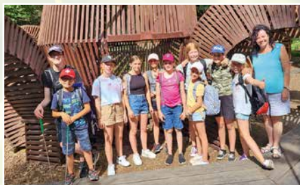
15 juin: sortie du Madep de Vex au parc Western City de Martigny.