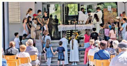
12 juin: messe de clôture de l'année pastorale au CO d'Euseigne.