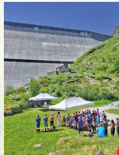
19 juin: messe de la Saint-Jean au barrage de la Dixence.