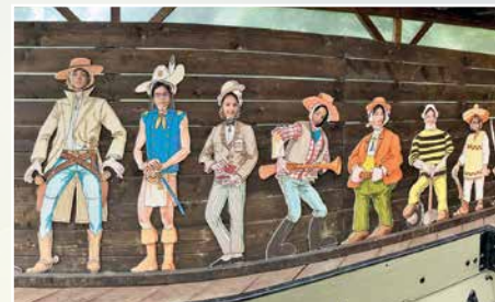
8 juin: sortie du Madep d'Hérémece au parc Western City de Martigny.