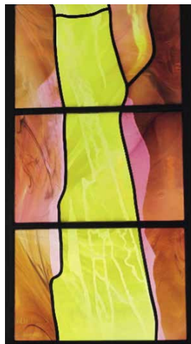
Dieu dit: « Que la Lumière soit. Et la Lumière fut... Dieu appela la Lumière Jour et les ténèbres Nuit. » (Gn 1, 3-5)