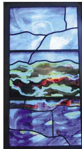
« Dieu fit le firmament et il sépara les eaux qui sont en dessous du firmament et celles qui sont en dessus... » (Gn 1, 6-8)