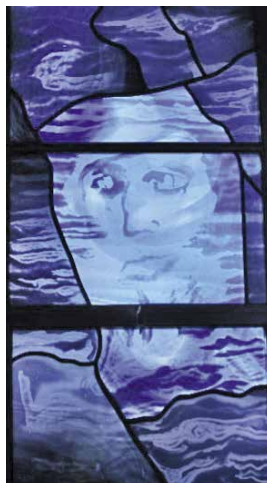
« La terre était informe et vide... L'Esprit de Dieu planait sur les eaux. » (Gn 1, 2)