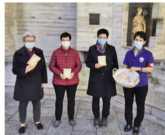
Distribution des soupes à Hérémençe.

Une belle façon de joindre l'utile à l'agréable!