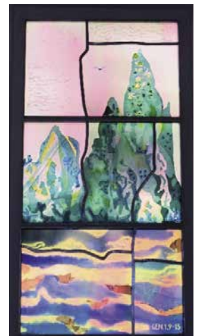
Dieu dit: « Que la terre produise de la verdure, des herbes portant semences... » (Gn 1, 9-13)