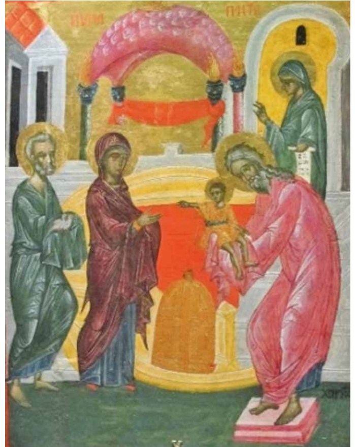
Maestro Giovanni (Arte Greco-Macedone, fin XVI e siècle). Présentation de Jésus au Temple, Musées du Vatican.

Cet épisode scelle le lien entre l'Ancienne et la Nouvelle Alliance de Dieu avec les hommes. Le tissu rouge qui relie les deux colonnes du Temple en est le symbole.