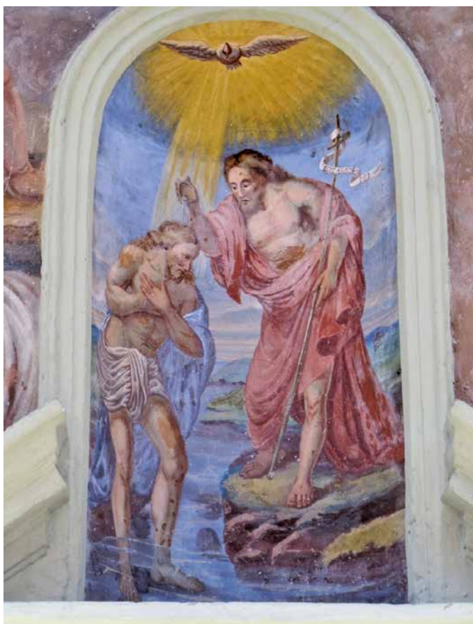
Peinture sur la façade de l'église de Lignod, Val d'Ayas, vallée d'Aoste.